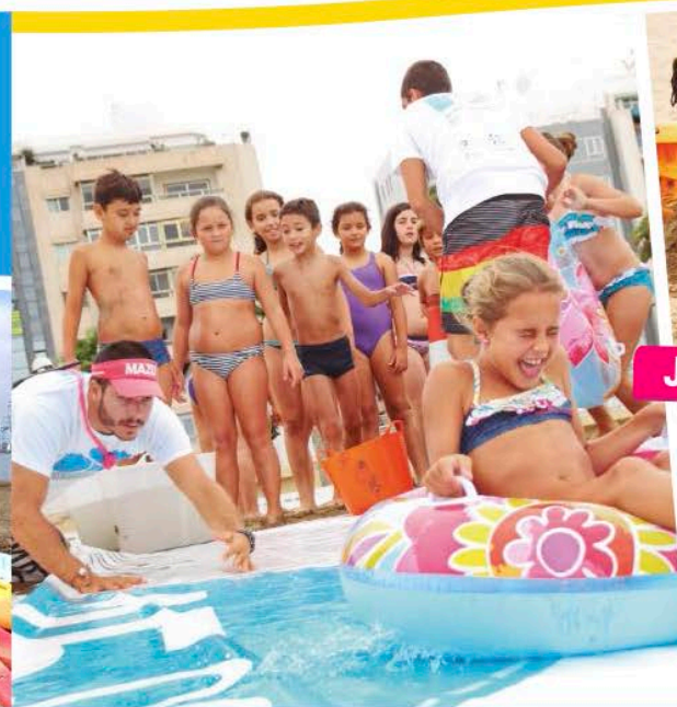
Juegos y deportes de playa